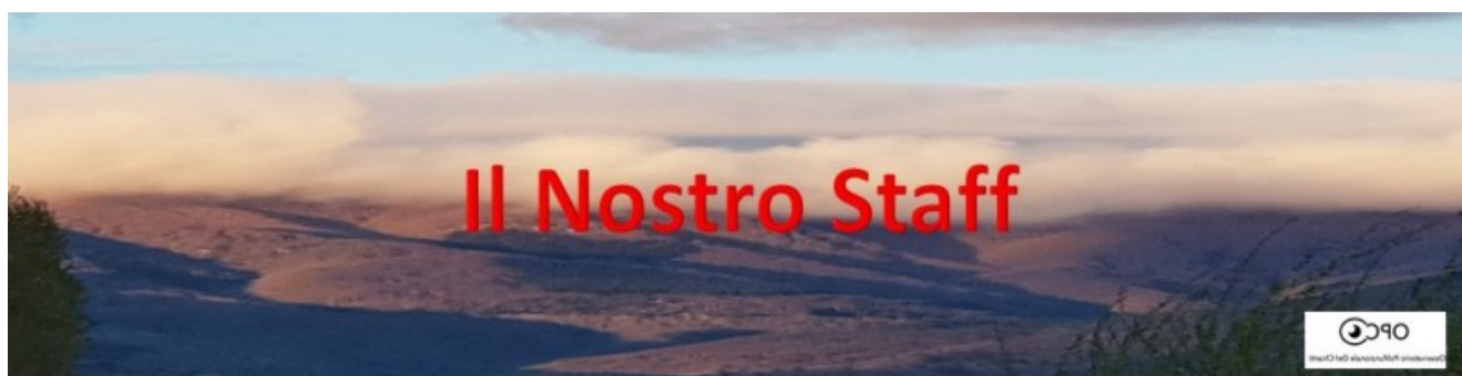
Festa del 10+1 dell'Osservatorio Polifunzionale Chianti 2021 - Sez. Meteo

Questo è lo staff dell'Osservatorio Meteo OPC, clicca qui per conoscerci